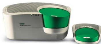
QX200™ Droplet Digital™ PCR システム